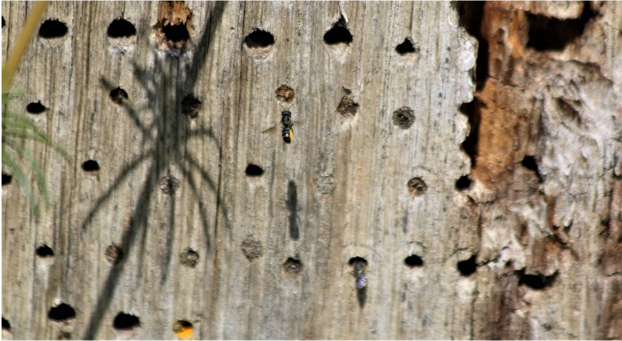
Foto 5: Gewöhnliche Löcherbiene ( Heriades truncorum) im Anflug auf eine der Nisthilfen in UF 1 und bereits verschlossene Nester der Glockenblumen-Scherenbiene ( Chelostoma rapunculi).