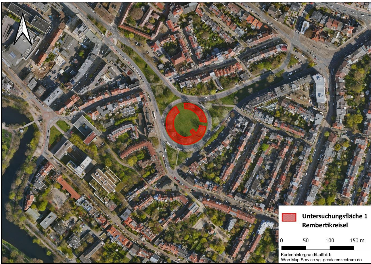
Karte 2: Untersuchungsfläche 1 (UF 1) Rembertikreisel

Die Untersuchungsfläche am Hochschulring (UF2, s. Karte 3) wurde ebenfalls 2016 angelegt und befindet sich unmittelbar am nördlichen Rand des Bremer Stadtgebietes im Stadtteil Lehe parallel zum Hochschulring zwischen Kuhgrabenweg und Klagenfurter Straße. Entlang des nördlichen Straßenrandes wurde hier auf dem etwa 15 m breiten Grünstreifen zwischen Fußweg und Straßenrand ein 1 - 2 m breiter Blühstreifen auf einer Länge von ca. 450 m angelegt. Die übrige Fläche des Grünstreifens wies viele sandige Offenbodenstellen auf. Der Blühstreifen setzt sich in westlicher Richtung jenseits des Kuhgrabenwegs entlang des Hochschulrings fort, dieser Abschnitt wurde jedoch nicht untersucht. Die gesamte Untersuchungsfläche beträgt 0,5 ha. Die Untersuchungsfläche befindet sich, anders als UF1, nicht in zentralurbaner Bebauung, sondern unmittelbar am Stadtrand im Technologiepark. Die Bebauung ist hier deutlich offener und die Versiegelung des Bodens wesentlich geringer. Zwar gibt es viele große Gebäude, dazwischen befinden sich jedoch größere Abstände mit zahlreichen breiten Grünstreifen sowie teils breiten Entwässerungsgräben mit entsprechenden Böschungen. Der Technologiepark ist zudem geprägt von vielen offenen Brachen wie ausgewiesenen aber noch nicht bebauten Bauplätzen. Nahezu alle Gebäude in diesem Bereich verfügen zudem über Flachdächer, die zum Teil begrünt bzw. mit Kiesabdeckung