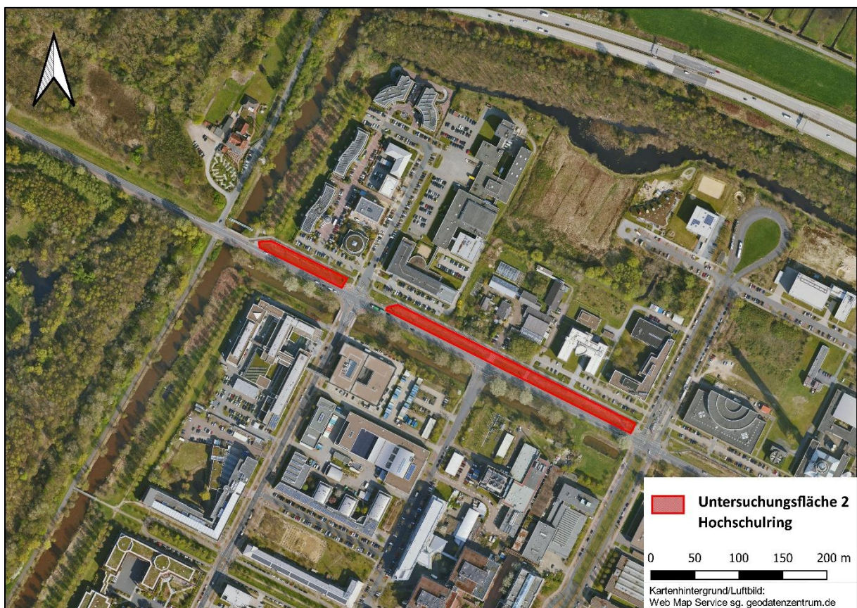
Karte 3: Untersuchungsfläche 2 (UF 2) Hochschulring

ausgestattet sind. Auf solchen Flachdächern entwickelt sich häufig eine magerrasenartige Vegetation mit wertvollen ruderalen Pollenpflanzen. In unmittelbarer Nachbarschaft zur Untersuchungsfläche befindet sich ca. 100 m westlich die sogenannte Uniwildnis innerhalb des NSG Stadtwaldsee. Etwa 350 m nördlich schließen sich jenseits der Autobahn A27 das NSG Hollerland mit zahlreichen blütenreichen Gräben und das NSG Kuhgrabensee an. Durch die unmittelbare Stadtrandlage steht die Untersuchungsfläche dort mit dem nördlichen Bremer Umland in Kontakt. Südlich befinden sich im näheren Umfeld zahlreiche offene Bauplätze sowie in ca. 1 km Entfernung ein großes Kleingartengebiet (s. Karte 4).