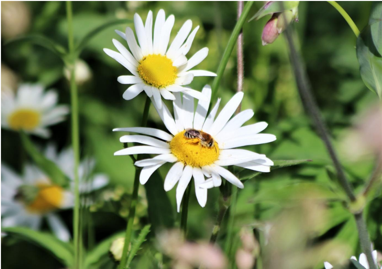
Foto 1: Rainfarn-Seidenbiene ( Colletes similis) an Margerite in UF 1