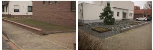
Lebensraum für Wildbienen?