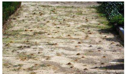
Massenvorkommen der Raufüßigen Hosenbiene