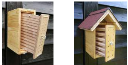
Beobachtungsröhrchen aus atmungsaktivem Holz, nur teilweise mit Acrylglas abgedeckt

Markhaltige Stängel, die man waagrecht anbringt, werden von Wildbienen in der Regel nicht angenommen (s. Abschnitt 3.8)