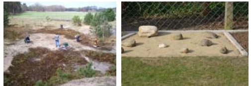
Rest-Binnendüne als natürlicher Lebensraum und Ersatzfläche im Garten